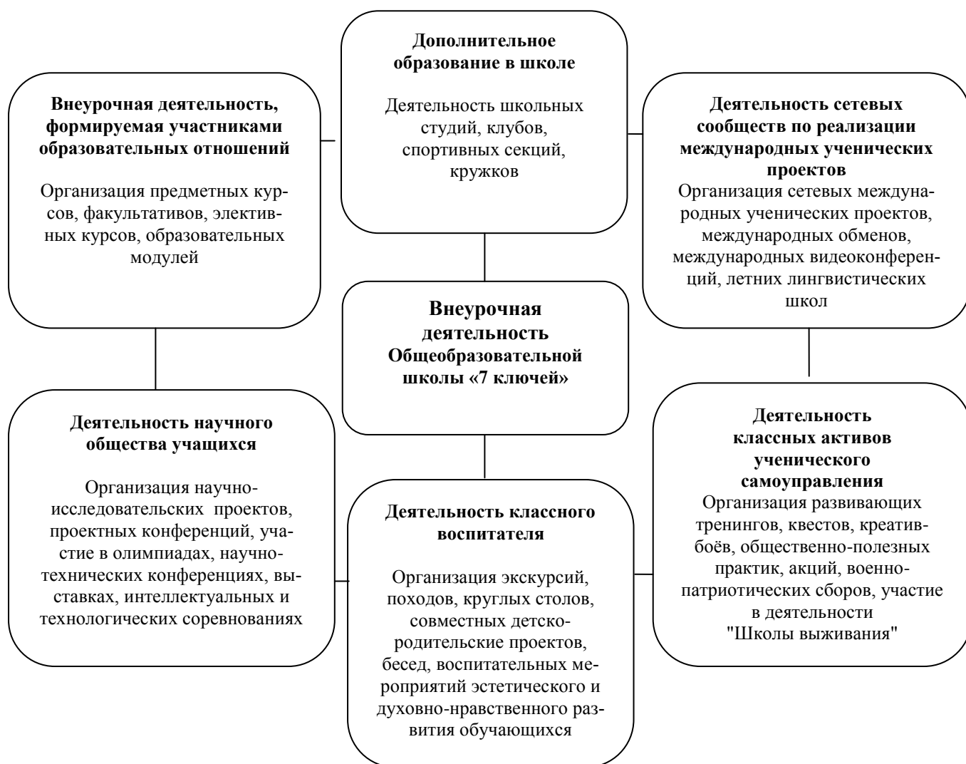
Рис. Модель внеурочной деятельности

Внеурочная деятельность в общеобразовательной школе «7 ключей» на уровне основного общего образования организована по смешанной модели, реализуется через систему воспитательной работы в рамках проектно-образовательной среды инновационной «школы полного дня», работу классных воспитателей, занятий на курсах (факультативах) внеурочной деятельности, как часть, формируемая участниками образовательных отношений, деятельность кураторов «групп полного дня», через занятия по программам дополнительного образования (секций, студий, клубов) организованных на базе школы, деятельность сетевых сообществ по реализации международных ученических проектов, деятельность научного общества учащихся, деятельность классных активов ученического самоуправления. Формирование курсов внеурочной деятельности осуществляется на основе запросов родителей обучающихся, интересов самих обучающихся по результатам ежегодного опроса, проводимого в мае и индивидуально при приеме в школу. Модель внеурочной деятельности представлена на рисунке и в таблице.